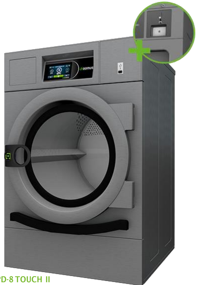
HPD-8 TOUCH II